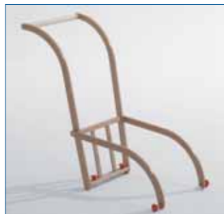
■ Schiebelehne mit rückseitigen Sprossen, Marke: Gloco, inkl. Befestigungskit, Art.-Nr. R8103