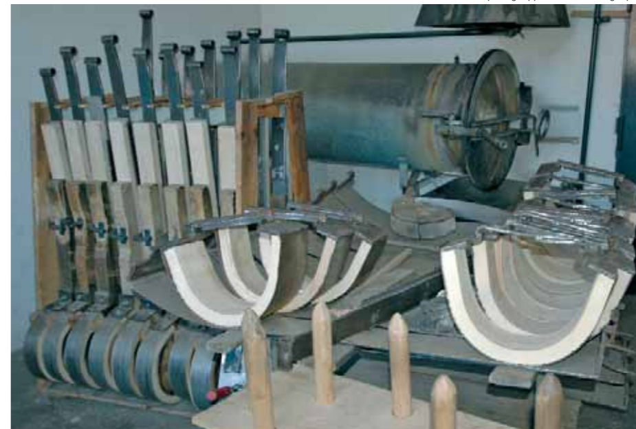
Dampfbiegeapparatur – Nostalgie pur.

Voll im Trend ist die neue Generation von sport - und rennrodeln , die immer mehr begeisterte Anhänger finden. Jeder dieser hochwertigen Rodel wird durch Fachleute gefertigt, die ihr Handwerk mit Stolz ausüben. Auf diese Art wird jeder Gloco - und sirch -Schlitten zu einem Familienmitglied, das dank seiner beinahe unzerstörbaren Robustheit Generationen durch die Wintermonate begleiten wird.