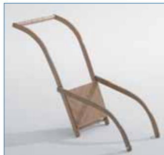
■ Schiebelehne mit rückseitigem Brett, geschraubt, Marke: Sirch, inkl. Befestigungskit, Art.-Nr. R8102