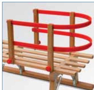
■ Kindersitzli aus Buchenholz und Kunststoff, Marke: Gloco, Art.-Nr. R8104