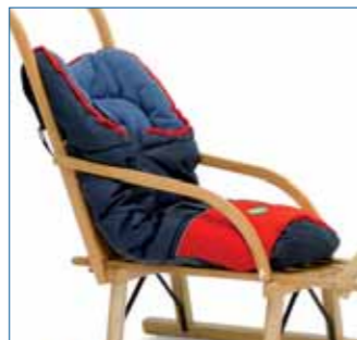
■ Babysack SCOOBEE, Cordura-Nylon, mit flauschiger Füllung, Art.-Nr. R8110