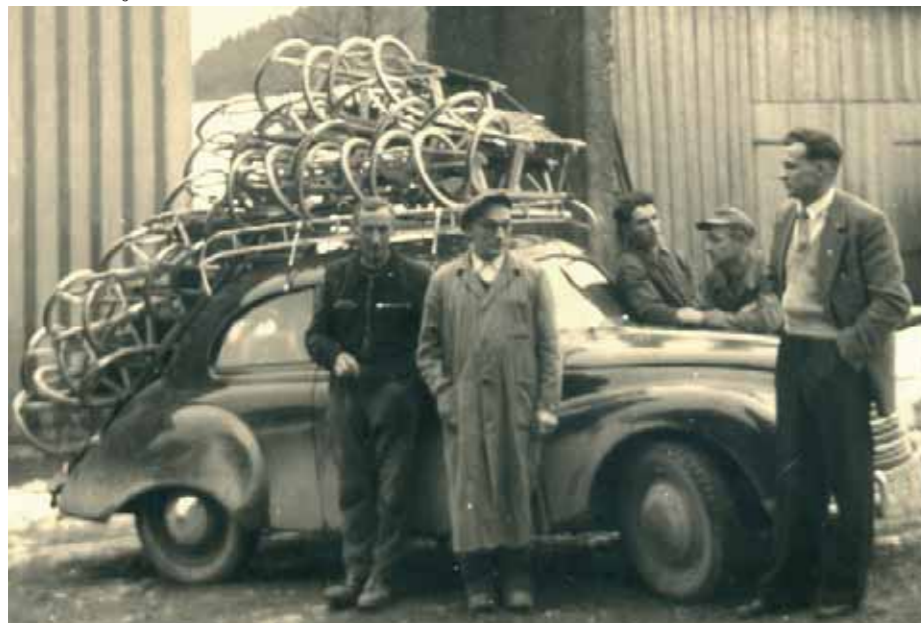
Schlittenerlieferungen anno 1953 mit DKW «Meisterklasse».

Tradition und Liebe zum Kunsthandwerk verbinden die Marken Gloco und sirch . Höchste Qualität und Zuverlässigkeit beginnt für sie bei der Wahl des Werkstoffes, ausschliesslich edlen Laubhölzern. Und sie stecken seit Jahrhunderten ihr Können und ihre Visionen in die Entwicklung von Spiel- und Sportgeräten, die höchsten Ansprüchen genügen und dank traditionellem Selbstbewusstsein auch in Zukunft wegweisend bleiben. Kein Wunder, fahren tausende von Kunden weltweit begeistert auf die Qualitätsprodukte von Gloco und sirch ab.