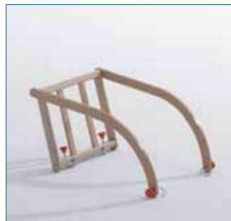
■ Kindersitzli mit rückseitigen Sprossen, Design wie Schiebelehne, Marke: Gloco, Art.-Nr. R8105