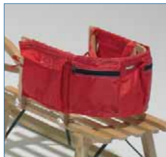
■ Kindersitzli aus Birkenholz, halbrund vorgeformt, Marke: Sirch, inkl. Taschenset aus Stoff, Art.-Nr. R8106